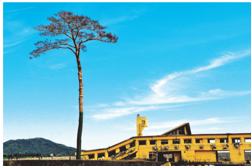
奇跡の一本松モニュメント事業で 航空機材料を使用した構造設計を提案して社会貢献